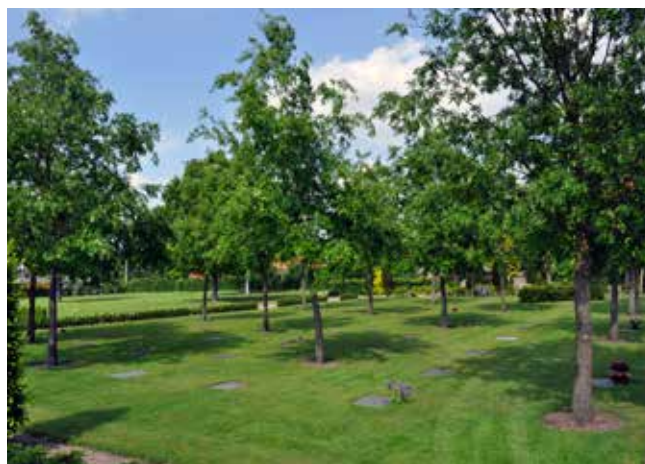
Urneplæne med Quercus cerris som karaktergivende træer