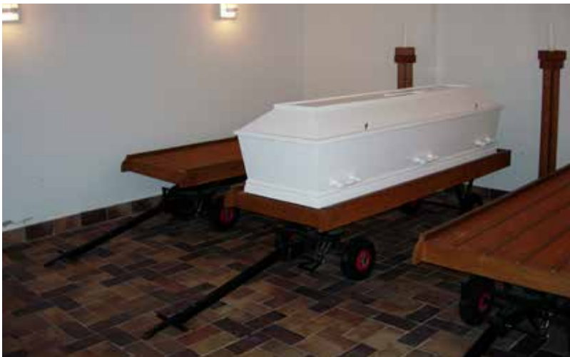
Katafalkerne bruges til afsætning, når bedemændene kommer med kisterne.