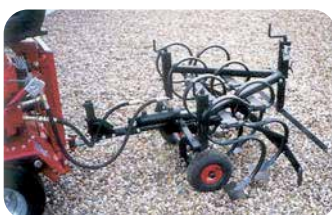
ØKO river, bugseret, i lift eller i trepunktsophæng.

Effektiv løvsugning er CATMAN's speciale - Alle løvsugere har knive til findeling af opsuget materiale.