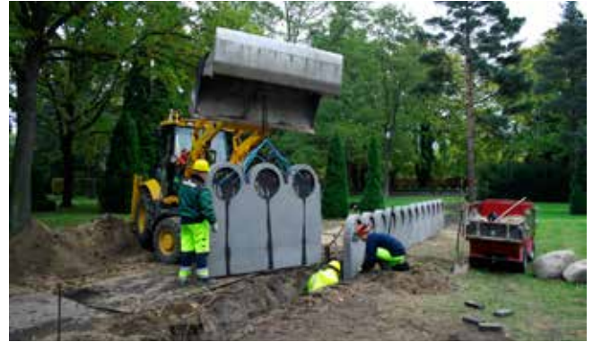
Muren til mindeplader skal symbolisere skjoldene, som de sidder på siden af et vikingskib. Med tiden skal muren favne hele gravpladsen. Der kan opsættes mindeplader af sten, jern eller træ i de udsparede rundinger i muren.

betydning. Der indgår således 18 sten i skibssætningen, der er 18 meter lang og 9 meter bred og orienteret efter solens bane. Stenene er nøje udvalgt af Forn Sidr i en nærliggende Fynsk grusgrav, og hver enkelt sten er placeret efter deres anvisninger.