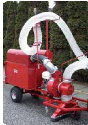
CATMAN løvsuger på trailer med 0,5m3 container