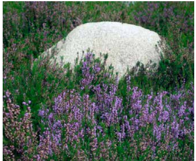
Gravstenene på ”Heden” skal være upolerede natursten eller marksten. Vedligeholdelsen er obligatorisk og prisen er den samme som for et gravsted i fællesplænen.