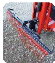
Ukrudtsrive justerbar i bredde.

Fabrikation: J.N.Jensen & Sønner ApS 6534 Agerskov - Tel. 74833108 www.catman.dk