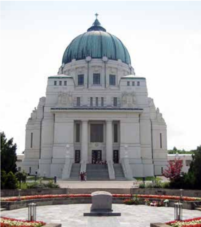
Karl-Borromäus-Kirche ligger på Zentralfriedhof, Wiens største kirkegård (grundlagt 1874, 250 ha, 330.000 gravsteder, 3 mio. begravelser gennem årene). I forgrunden Präsidentengruft, hvor Østrigs præsidenter siden 2. verdenskrig er blevet begravet, bl.a. Kurt Waldheim.