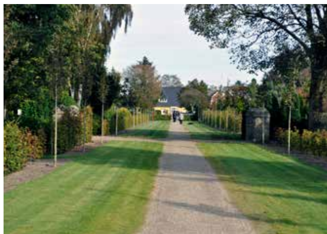
Nyplantet allé af Tilia platyphyllos 'Ørebro'

Nu er en formel uddannelse kun et grundlag. For at fungere i et arbejdsliv, skal den ses i sammenhæng med det arbejdsliv og de erfaringer som opnås derigennem. Tilfældigheder gjorde, at jeg kom til at arbejde med skovplanter, som driftsleder ved Hedeselskabets Planteskoler, siden som direktør for Arborea Dania i Løsning. Herefter var jeg udsendt som Longterm Advisor på et EU projekt i Litauen, hvor jeg stod for planlægningen af en skovplanteskole. Den skal, ud over