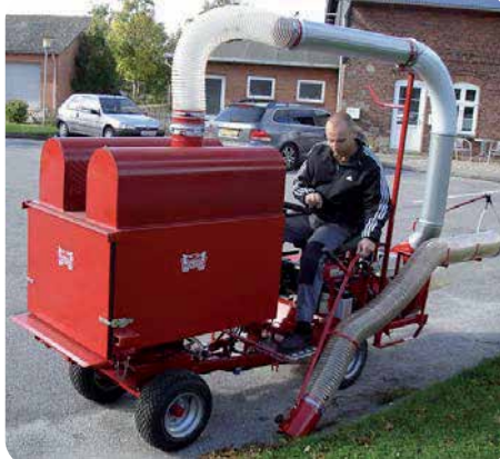
CATMAN løvsuger i lift med 0,5 m3 container.