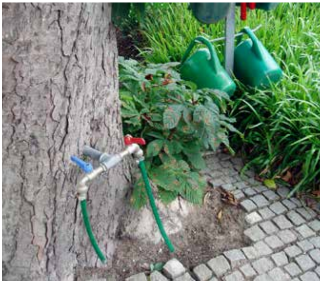
”Indlagt vand” har en anderledes betydning på Viborg Kirkegård.