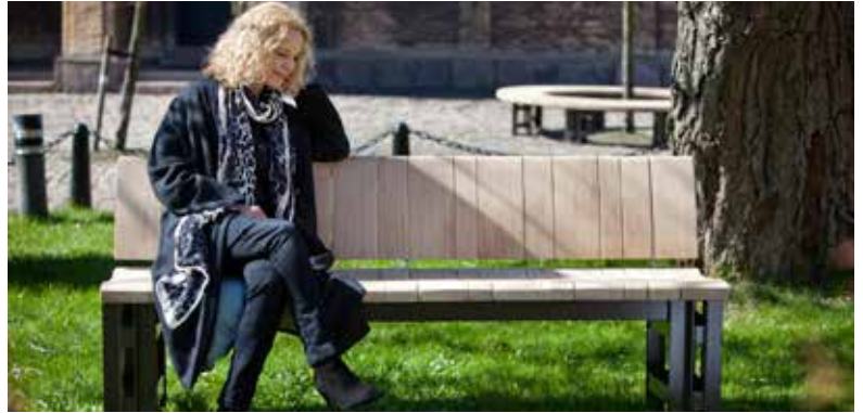
Bænkserien "Frederik den 6." er en videreudvikling af "Holmen"