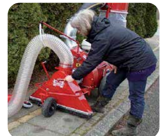
Bredsugestuds med omskifter - hurtigskift fra slange til bredsug.

Effektiv løvsugning er CATMAN's speciale - Alle løvsugere har knive til findeling af opsuget materiale.