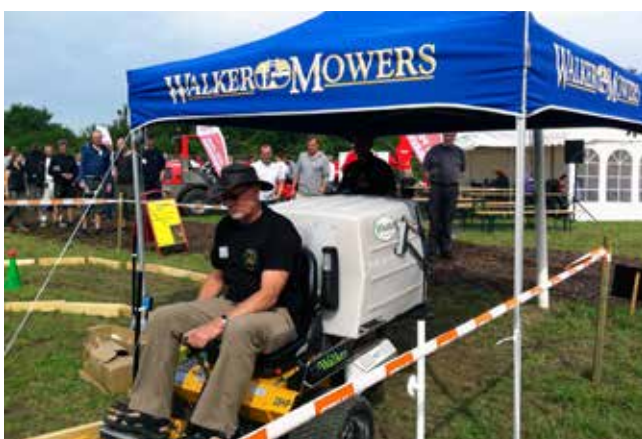
Deltagerne konkurrerede i præcisionskørsel på tid på en forhindringsbane.