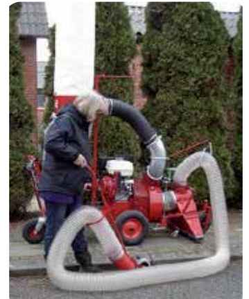
Mobil løvsuger, hydrostatisk fremdrift.