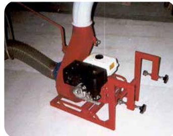
Montering på bagsmæk.