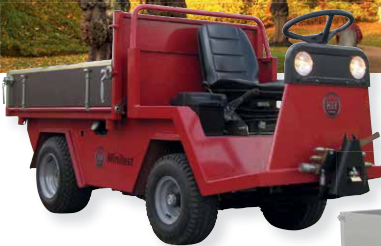
MINILAST - en HTF klassiker

Vores store produktprogram sikrer altid den rigtige løsning til den rigtige pris. Ring til Danmarks største leverandør af køretøjer til kirkegårde, både når det gælder salg, service og reservedele.