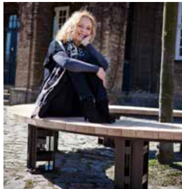
Bænkserien "Flow" kan sammensættes til cirkler eller snoede forløb