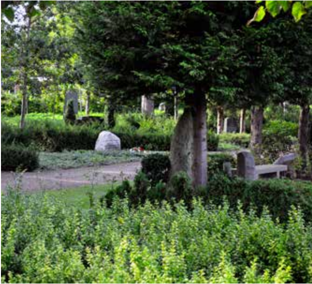
Parti fra Ny Kirkegård, med urnegravsteder i vinca i baggrunden