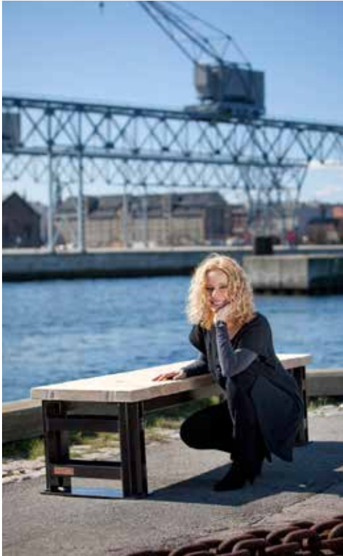
Bænkserien "Holmen" er fremstillet af 350 år gamle bolværkspæle fra Holmen