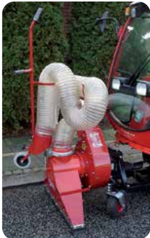
Løvsuger for traktordrift.