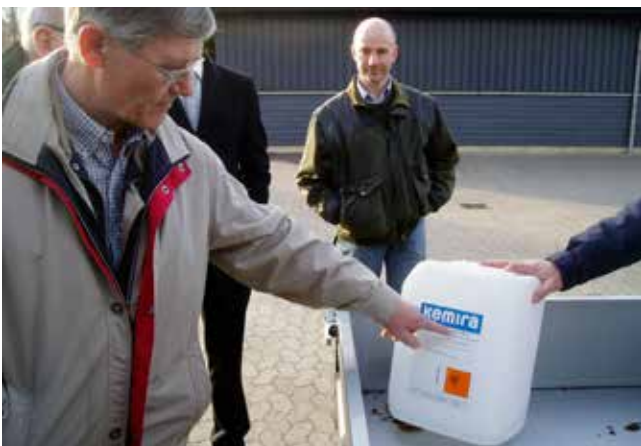
Methanol brænder meget rent og kan håndteres i det eksisterende distributionssystem.