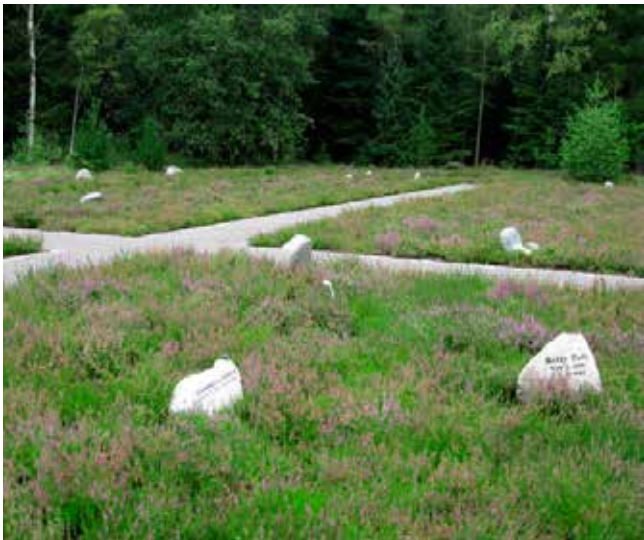
”Heden” er tilplantet med Calluna vulgaris 'Kongenshus' og ligner en lille hede flade i en lysning i skoven.