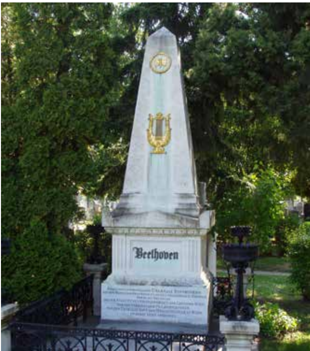
Komponisten Ludvig van Beethoven døde længe før Zentralfriedhof blev grundlagt. Men han er blevet flyttet til denne æresgrav årtier efter sin død.