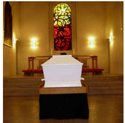
Når katafalken bruges i kirken er trækstangen afmonteret og et klæde sættes fast med velcro-bånd.

Håndtering af kister kan nogle steder være et stort problem for kirkens og kirkegårdens personale. I Humlebæk blev problemet løst med anskaffelsen af 3 katafalker, der blev bygget op over en 4-hjulet trækvoan.