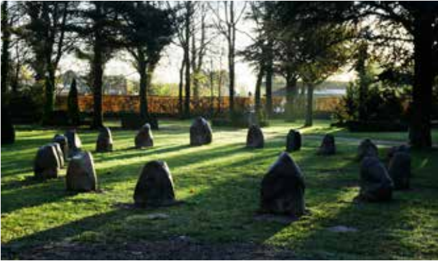
Skibssætningen/ gravpladsen er skabt i samarbejde mellem Forn Sidr, arkitekt Palle E. Andersen og Kirkegårdskontoret.