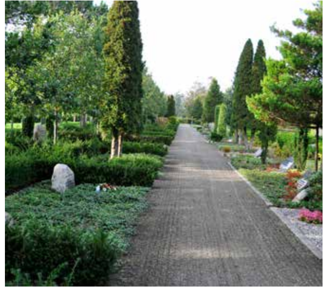
Parti fra Ny Kirkegård, med urnegravsteder i vinca og lapidarium bagved.

at producere skovplanter, også være en inspiration for udviklingen af skovplanteskoler i Litauen. Herefter overtog vi planteskolen ved Grindsted.