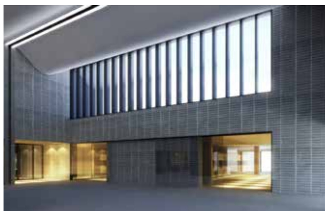
Det nye Fælleskrematorium i Ringsted er tegnet af Henning Larsens tegnestue

Licitationen blev vundet af ELINDCO A/S med en byggesum på 57,5 mio. kroner. ■