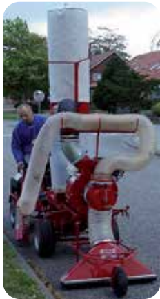
Skifteladsløvsuger på CATMAN transporter.

* Hydrostatisk drift * Servostyring * Bredde kun 80 cm * Drejelad med hydraulisk tip - ladmål 125x80 cm * Praktisk skifteladssystem for jordkasser løvsuger, løvcontainer eller andre ladtyper.